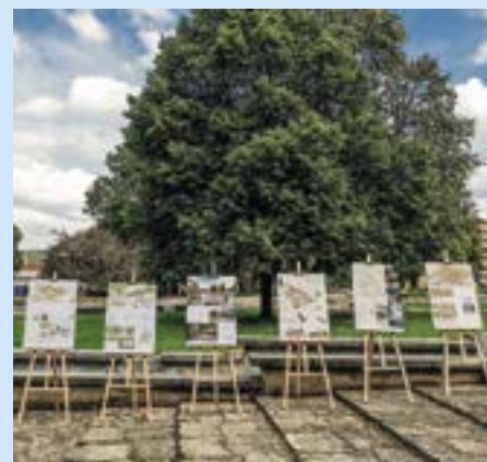
Návštěvníci slavnosti si mohli prohlédnout všechny soutěžní návrhy na obnovu parku.