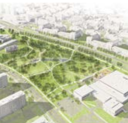
Takto bude park vypadat v roce 2022

Hospodaření s dešťovou vodou (HDV) je důležitý nástroj boje s klimatickými změnami. Zadržování dešťové vody ve městech může přispět k velkým úsporám vody a také příjemnějšímu životu jeho obyvatel. Proto jsme v říjnu podpořili konání online debaty s odborníky na toto téma. V rámci debaty představili architekti z ateliéru Rehwaldt Landscape Architects řešení HDV v parku Střed v Mostě i v dalších projektech ateliéru.