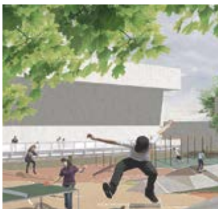
Multifunkční hřiště a platforma pro skate

I vy můžete proměnit své město! Nadace Proměny Karla Komárka vyhlásila další ročník grantové výzvy programu Proměň své město. Hlásit se mohou neziskové organizace, které chtějí proměnit veřejný prostor ve svém městě, dočasně či trvale. Úspěšní žadatelé získají grant ve výši až 200.000 Kč a individuální podporu z oblasti fundraisingu, PR a projektového řízení. Čas na přípravu projektu a odevzdání přihlášky máte do 31. 12. 2020. Více informací a přihlášku naleznete na webu www.promensvemesto.cz