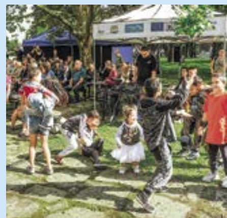
Zahradní slavnost v parku Střed

S vítězným návrhem se veřejnost mohla seznámit během Zahradní slavnosti přímo v parku Střed. Návštěvníci akce se mohli zapojit do debaty s vedením města, architektky a zástupci Nadace Proměny Karla Komárka. Připomínky veřejnosti a dotčených orgánů architekti zapracovali do architektonické studie. Nyní architekti pracují na projektové dokumentaci a podkladech pro získání územního a stavebního povolení.