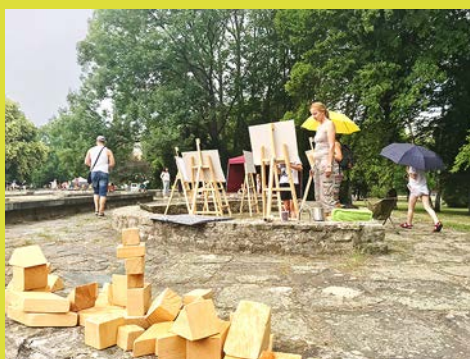
Víkend otevřených zahrad 2018

Nadace Proměny Karla Komárka uvolní postupně na obnovu parku 25 milionů korun. Částka zahrnuje náklady na přípravu projektu a úvodní zapojení veřejnosti, architektonickou soutěž, projektovou dokumentaci, stavební a vegetační úpravy, včetně uměleckých či herních prvků, ale také příspěvek na následnou údržbu a další rozvoj parku. Právě podmínkám, za nichž bude reálně udržovat obnovený park ve skvělém stavu i do budoucna, bude věnována velká pozornost už při výběru vítězného řešení. Most se bude na realizaci projektu podílet částkou do maximální výše 48 milionů korun.