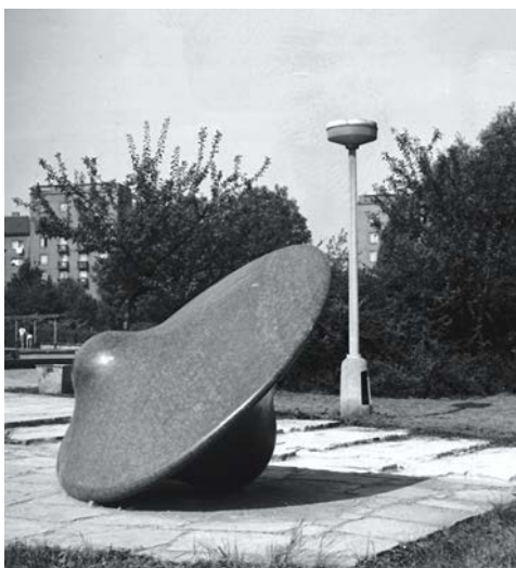
Josef Klimeš: Biologické těleso v 70. letech