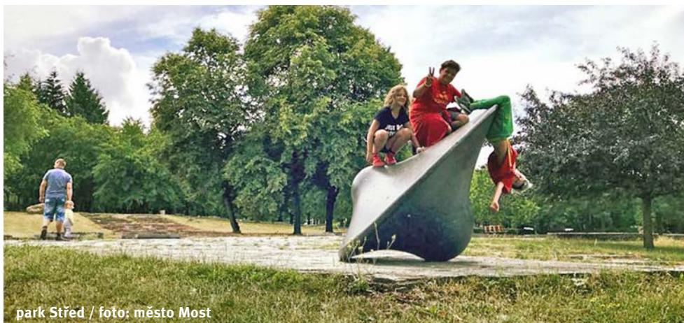
park Střed

2022 / Stavební a vegetační úpravy Dokončení stavby, otevření